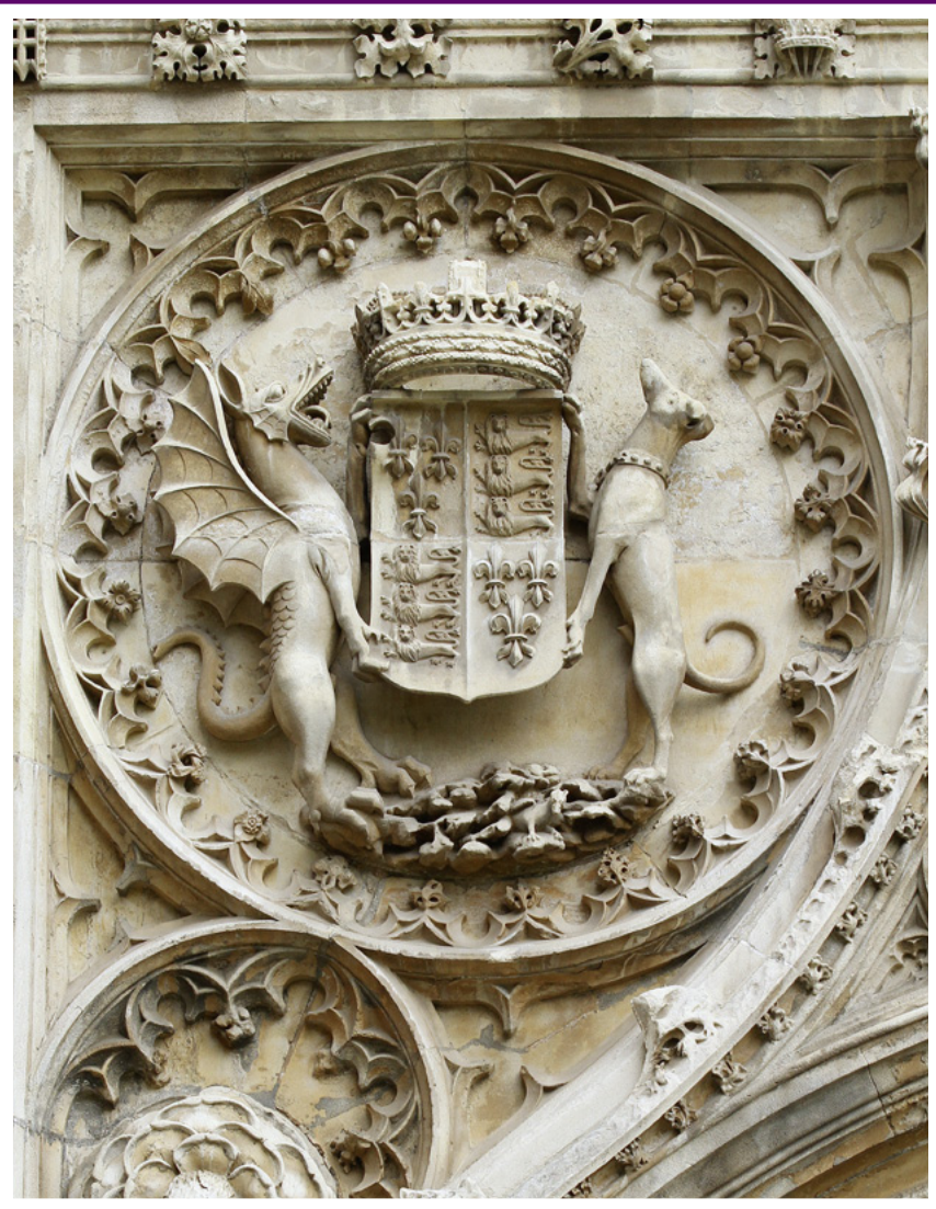
First Page Image Exterior masonry detail, Chapel of King's College, Cambridge.