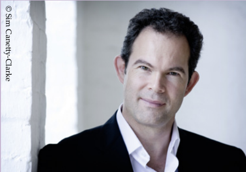
GERALD FINLEY, BASS-BARITONE

Internationally acclaimed, Grammy and Juno-award-winning Canadian baritone Gerald Finley began singing as a chorister in Ottawa before completing his musical studies in the UK at the Royal College of Music, King's College, Cambridge, and the National Opera Studio.